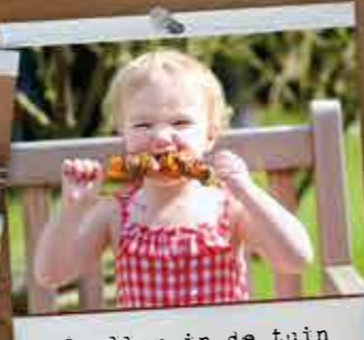
Smullen in de tuin

Kijk voor de actuele prijzen in onze webshop!